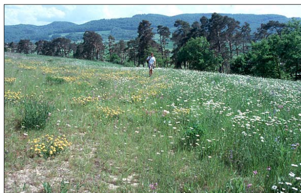
Figure 4. Etat 2 ans après les travaux.