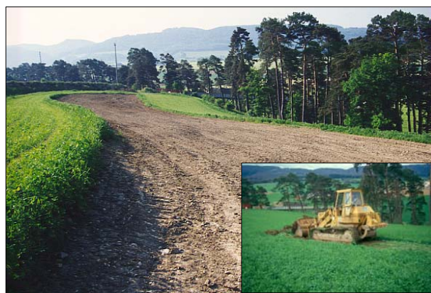
Figure 2. Terrassement de la terre végétale et état initial.