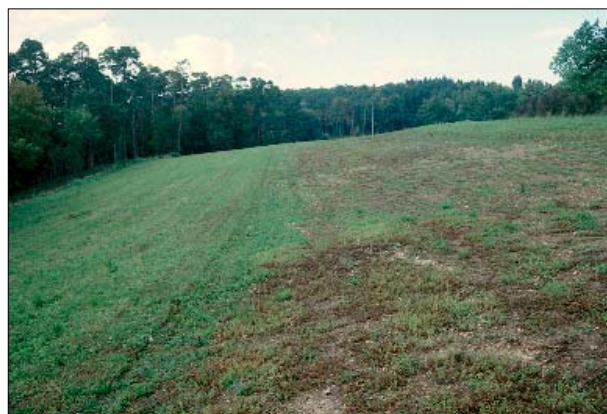
Figure 3. Etat après semis et 1 ère fauche.